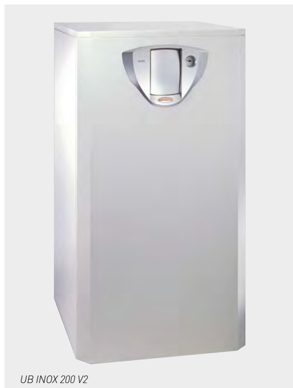
UB INOX 200 V2