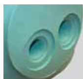
Raccordi di stampata